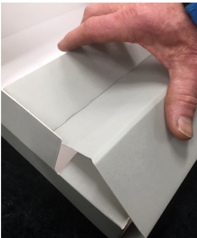
Bild 7. De kortare delarna ska vara stöd för facket i lådan. Vik den ena av falsarna på lång- sidan åt "fel" håll. Se till att komma mellan den långa och korta delen med invikningen.