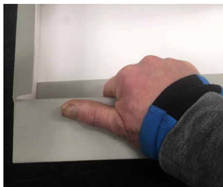
Bild 8. Vik in under de korta delarna så att ett fack bildas.