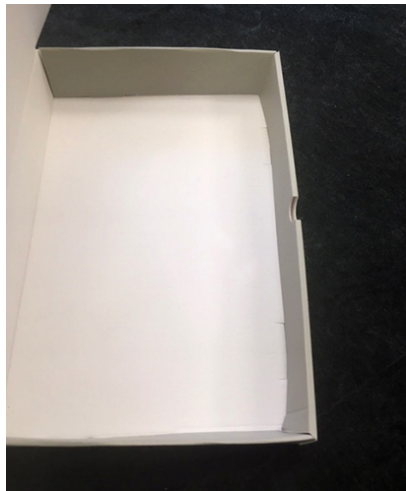
Bild 5. Nu är locket färdigt.