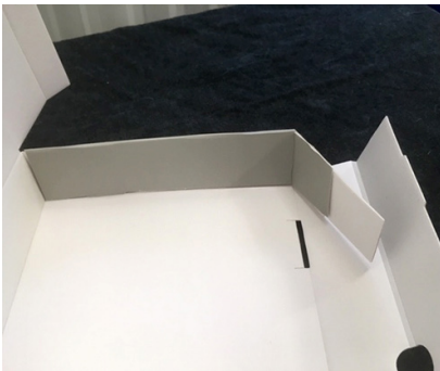
Bild 4. ...och vik in de yttre delarna som ska låsas genom vikning av locket långsida.