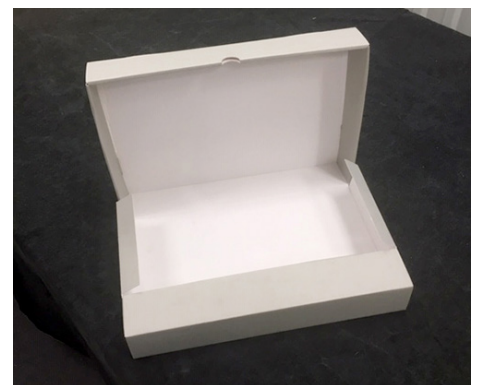
Bild 9. Nu är hela lådan med lock färdig.