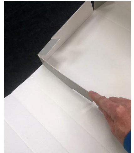
Bild 6. Nu går vi till lådan. Vik in som bilden. Observera att kortsidan har två delar.