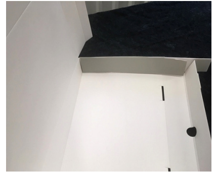
Bild 3. Börja med locket. Vik upp kortsidorna och...